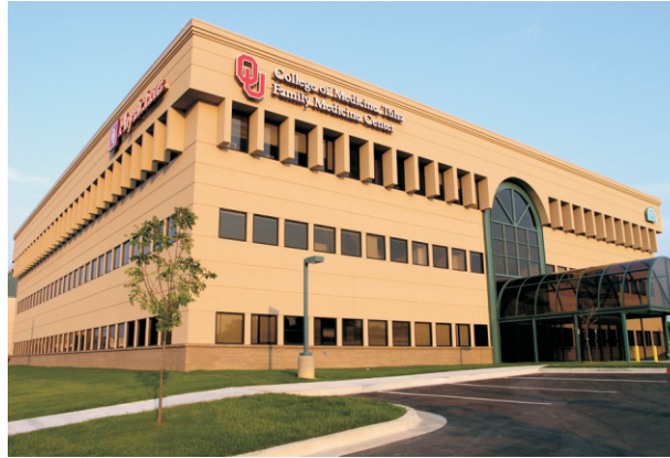
OU Family Medicine Center