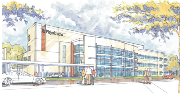
OU Tulsa Research and Medical Clinic